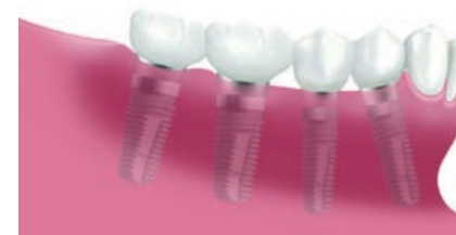
Vier implantaten elk voorzien van een kroon