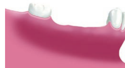
Situatie na verlies van meerdere kiezen

Met implantaten is het mogelijk weer een vaste voorziening terug te krijgen. Er worden dan op de plaatsen van de ontbrekende gebitselementen implantaten geplaatst met daarop enkelvoudige kronen of een brug.